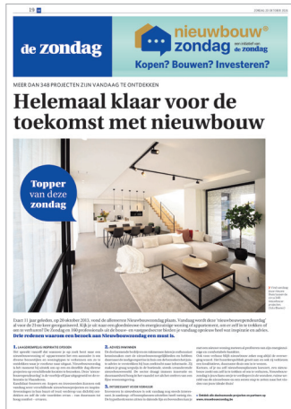
Voorbeeld intropagina redactie