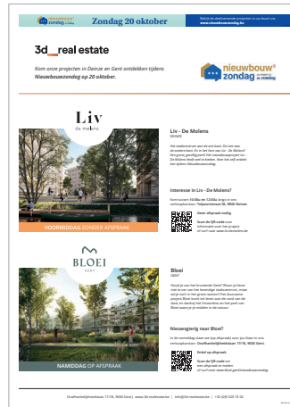
Voorbeeld 1/1 pag.