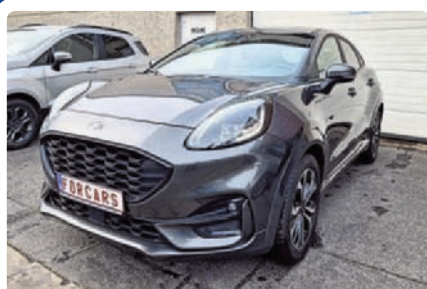
FORD PUMA 1.0 ECOBOOST HYBRID 125PK ST LINE NAVI