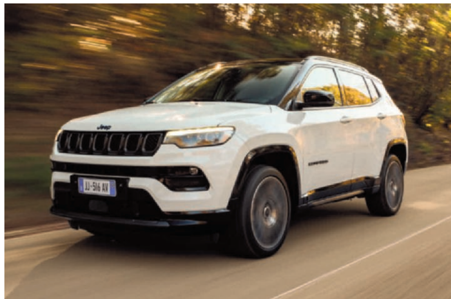
▶ Jeep Compass: Amerikaans icoon met Europese manieren. (gf)

aandrijving: benzine vermogen: 110 kW 0-100 km/uur: 10,3 sec. verbruik: 6,7 liter/100 km CO 2 -uitstoot: 152 g/km prijs: 33.390 euro