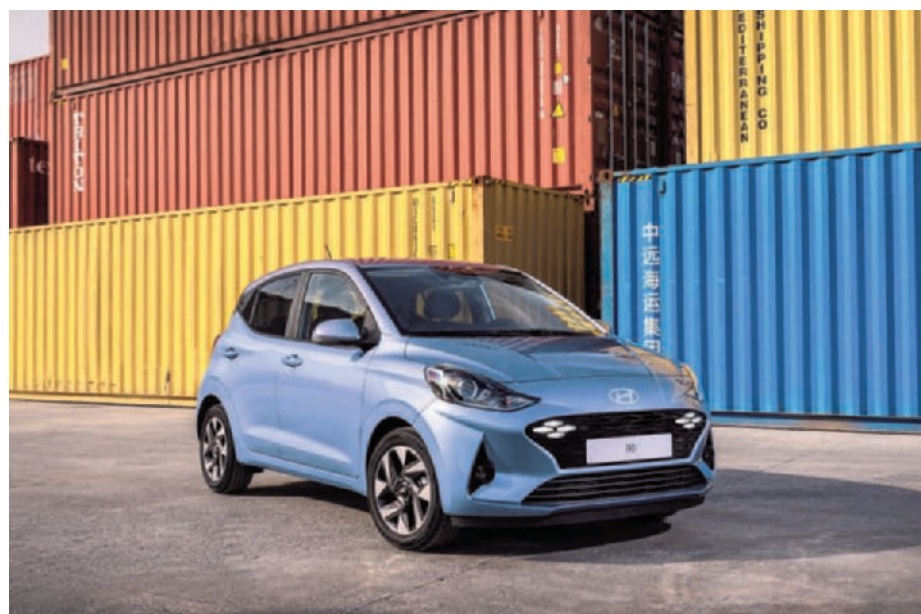
► Hyundai i10 is een sterkhouder in een krimpsegment. (gf)