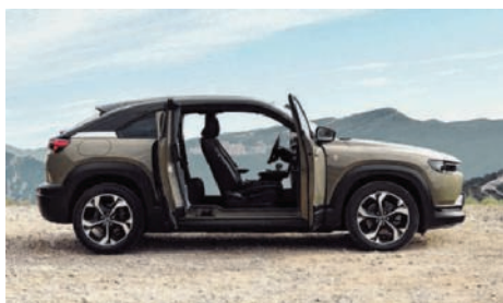
De MX 30 R-EV, elektrisch rijden zonder laadstress dankzij de rotatiemotor als stroomgenerator.

Bij Decocars kan je ook altijd terecht voor onderhoud en er is een groot aanbod van