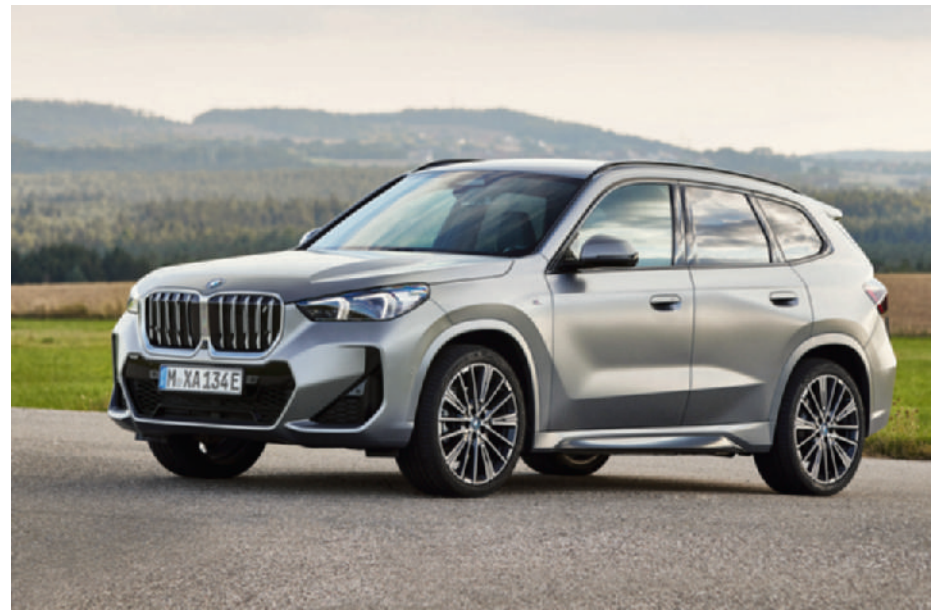
► De BMW iX1 kreeg een fikse groeischeut. (gf)

De gezinswagen Atto 3 doet het zeer goed, maar ook bij de compactere Dolphin en in de hogere klasse, de Seal, de Han en de Tang met extreme luxe, blijft de prijs/kwaliteit super interessant. De reden daarvan is dat de auto praktisch helemaal door BYD zelf gemaakt wordt. De kwaliteit weerkaatst bovendien in de zes jaar garantie en acht jaar op de batterij. Ontdek en ervaar BYD nu zelf in de showroom langs de Kuurnsesteenweg 107 in Kortrijk tijdens de open-deurdagen van januari. Elke zondag open!