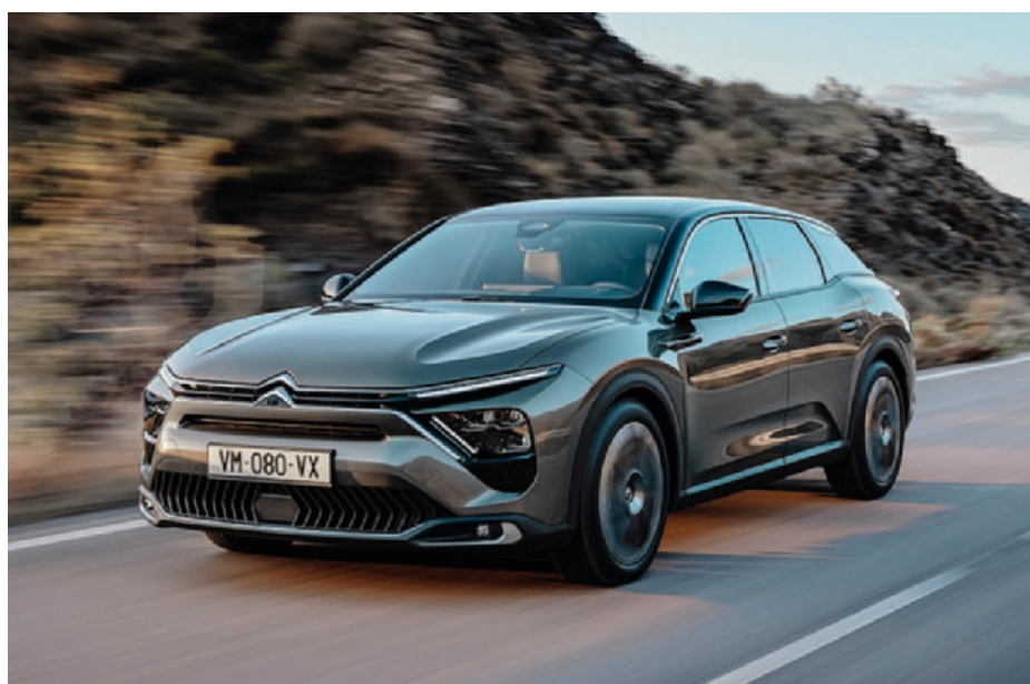
► Citroën C5 X is een mix tussen een hatchback, een coupé en een SUV. (foto Continental Productions)

aandrijving: elektrisch vermogen: 150 kW batterij: 65 kWh verbruik: 15,4 kWh/100 km actieradius: 474 km prijs: 49.950 euro