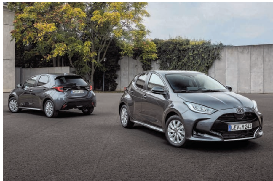
► De Mazda2 Hybrid: een kloon van de hybride Toyota Yaris. (gf)

Scan de QR-code en ontdek het ruime aanbod stockwagens bij Decocars.