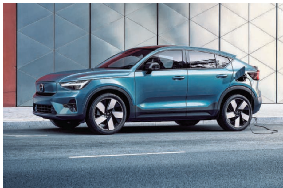
► Volvo C40 Recharge: de onderhuidse evolutie zorgt voor extra rijbereik. (gf)

premie van €5.000 van de Vlaamse Overheid. We hebben bijna het volledige gamma beschikbaar in plug-inhybride versie en ook reeds 4 modellen (EX30, XC40, C40 en EX90) in full electric. Er zijn voldoende stockwagens in de showrooms zodat alle bezoekers het volledige gamma van heel dichtbij kunnen bewonderen. Er staan bovendien een uitgebreid aantal wagens ter beschikking voor wie zich aan een proefrit wil wagen," besluit hij.