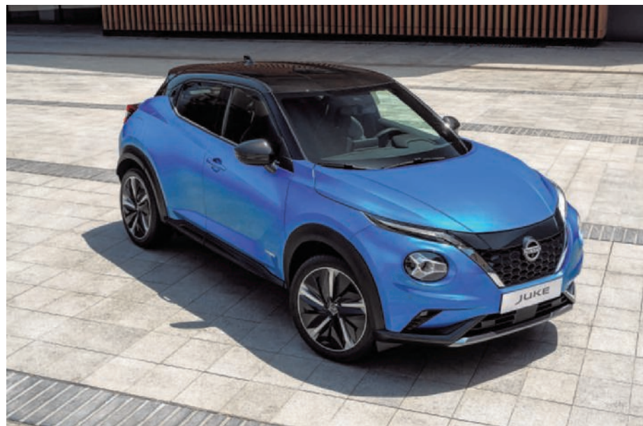
De Nissan Juke komt met een pak hedendaagse technologie. (gf)

aandrijving: benzine vermogen: 125 kW 0-100 km/uur: 8,3 sec. verbruik: 6,1 liter/100 km CO 2 -uitstoot: 139 g/km prijs: 38.250 euro