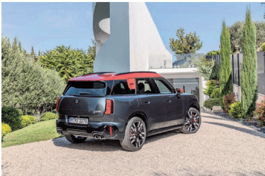
De Mini new Countryman kreeg een duurzamer en kwaliteitsvoller interieur.