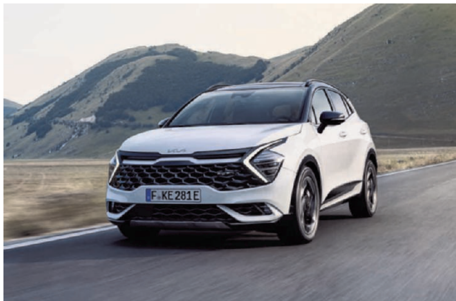
▶ De Kia Sportage is verkrijgbaar met alle mogelijke motortypes. (gf)