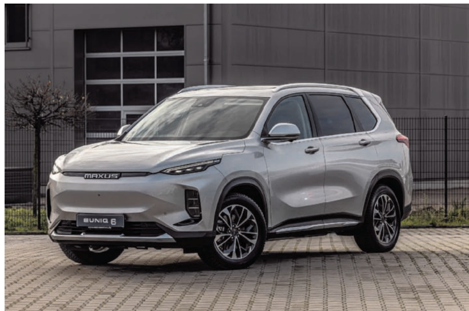
› De Maxus eUniq6 is een grote en riant uitgeruste e-SUV. (gf)

aandrijving: elektrisch vermogen: 5,6 kW batterij: 4,14 kWh verbruik: niet meegedeeld actieradius: 63-192 km prijs: 13.990 euro