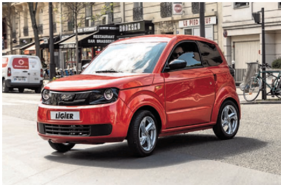
› Ligier Myli: rijden zonder rijbewijs kan nu ook elektrisch. (gf)