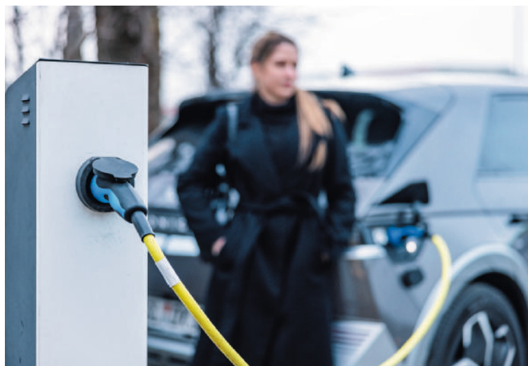
▶ Het aandeel elektrische bedrijfswagens verdrievoudigde vorig jaar.

Terwijl in 2022 nog bijna zes op de tien (57,8 procent) bedrijfswagens een dieselmotor hadden, zakte dat aandeel vorig jaar met bijna een kwart tot iets meer dan vier op de tien (43,7 procent). Dat komt onder andere omdat volledig elektrische auto's een doorbraak kenden: hun aandeel verdrievoudigde in een jaar tijd tot 10,1 procent. Ook hybride wagens blijven aan populariteit winnen. Het gaat dan vooral om hybrides op benzine (+78,6 procent tot 15,7 procent) en minder de dieselvarianten (+26,4 procent tot 1,4 procent). Het aandeel van traditionele benzineauto's onder