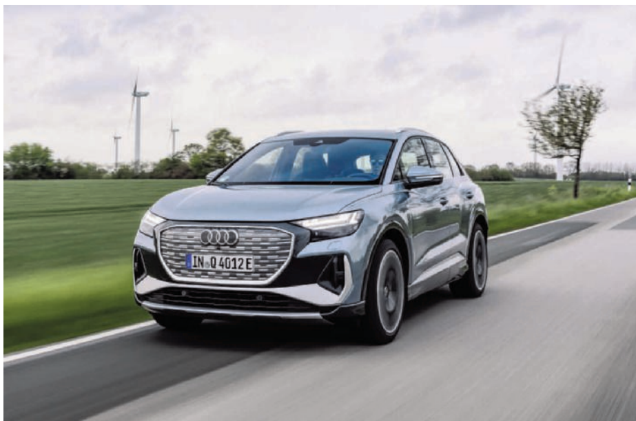
De Audi Q4 e-tron ziet er hetzelfde uit, maar is wel een stuk verbeterd. (gf)