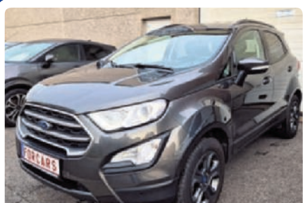
FORD ECOSPORT BENZINE 125PK AIRCO