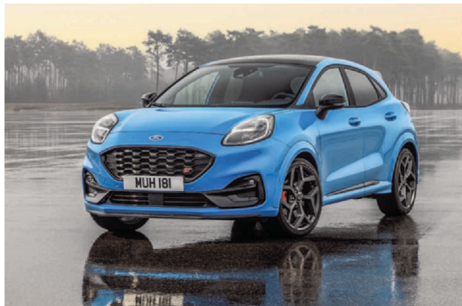
► Ford Puma: een stoere, zacht spinnende raskat. (gf)