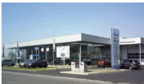
Bij Matcars vind je alle nieuwe modellen van Ford.

In het multifunctionele bedrijfspand van Matcars kunnen de klanten terecht voor de aankoop van nieuwe en gebruikte personen- en bedrijfsauto's, maar ook voor het onderhoud en de reparatie, het schadeherstel en inbouwwerkzaamheden van