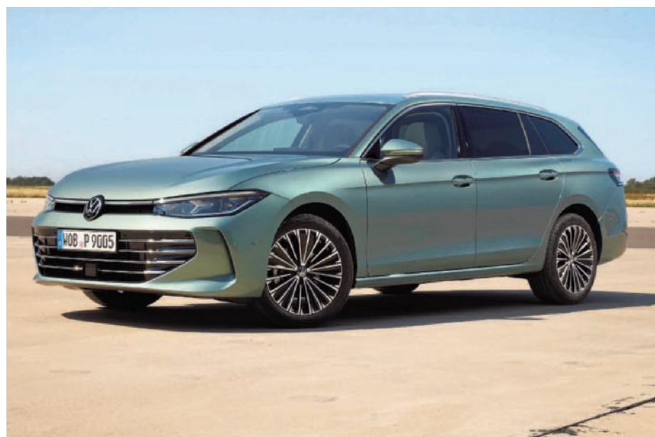
► De Volkswagen Passat heeft een afwerking op een nog hoger niveau dan vroeger. (gf)