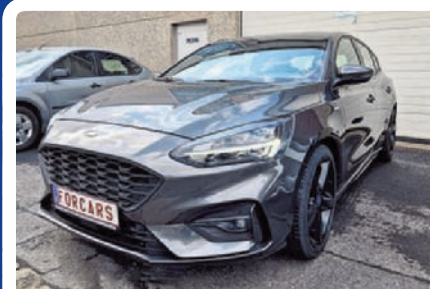
FORD FOCUS 1.5 ECOBOOST ST LINE 150PK 5 DEUR AIRCO