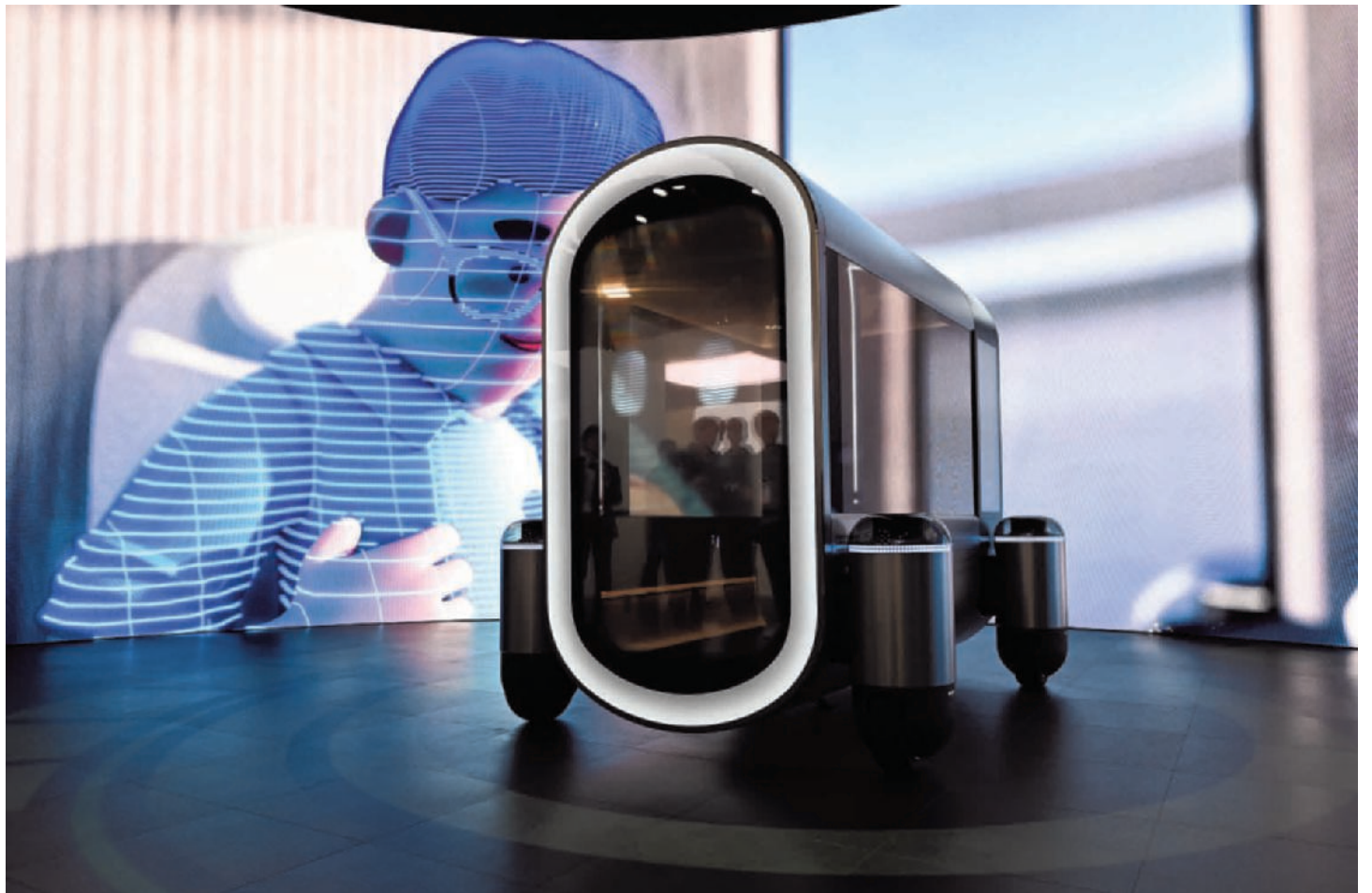
► De Hyundai DICE werd deze week in Las Vegas voorgesteld.

Daarnaast wil Hyundai nog meer inzetten op voertuigen op waterstof. Een pilootproject met door waterstof aangedreven vrachtwagens in Zwitserland, dat in 2020 van start ging, is zeer succesvol. (SRA)