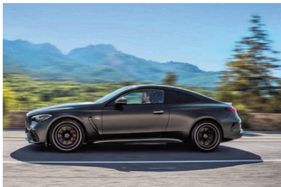
► De Mercedes-Benz CLE is de beklijvende opvolger van C- en E-Klasse Coupé.

de indruk achterlaat. Ghistelinck nodigt zijn klanten uit om deel te nemen tijdens de Salonmaand januari en te genieten van de verfijning en hartelijkheid die Le Bistrot de Paul en Le Bar de Vincent te bieden hebben. Info: www.ghistelinck.com