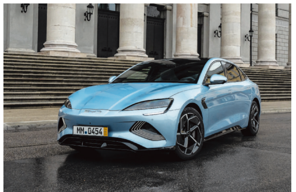
► De BYD Seal is bijzonder rijk uitgerust. (gf)

aandrijving: benzine vermogen: 96 kW 0-100 km/uur: 10,3 sec. verbruik: 6 liter/100 km CO 2 -uitstoot: 136 g/km prijs: 37.800 euro