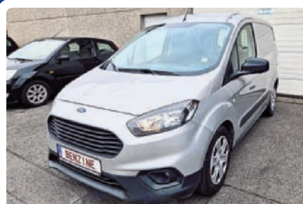
FORD TRANSIT COURIER 1.0 ECOBOOST 100PK 6V AIRCO