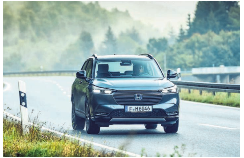
▶ De Honda HR-V is een hybride cross-over voor hippe gezinnen. (gf)

technisch aandrijving: benzine vermogen: 81 kW 0-100 km/uur: 9,7 sec. verbruik: 5,4 liter/100 km CO 2 -uitstoot: 123 g/km prijs: 26.850 euro