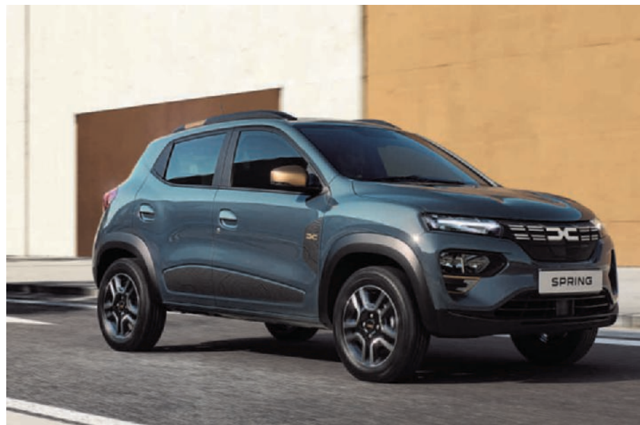
De Dacia Spring is nu ook verkrijgbaar in de krachtigere Extreme-uitvoering. (gf)

aandrijving: elektrisch vermogen: 210 kW batterij: 77 kWh verbruik: 16,4 kWh/100 km actieradius: 541 km prijs: 57.270 euro