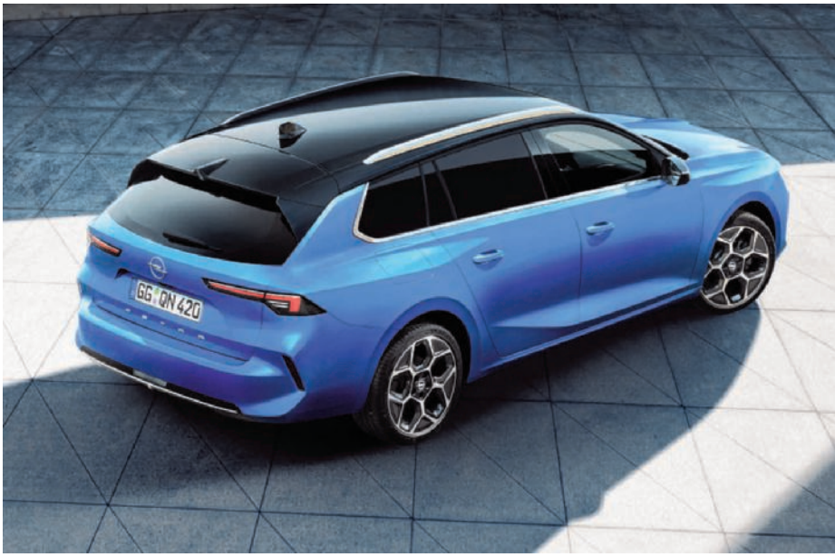
▶ Opel Astra: de Duitse evergreen kreeg een designerjasje. (gf)