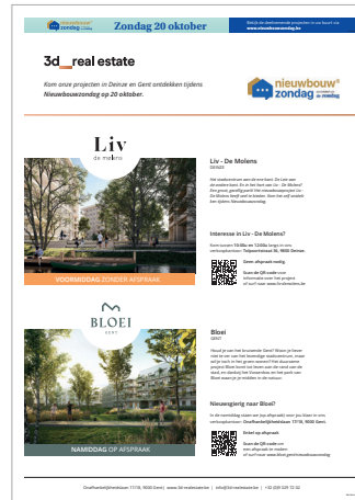
Voorbeeld 1/1 pag.